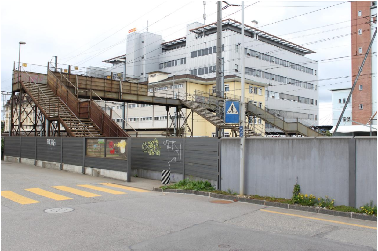
Zu grosse Hürde Coop-Passerelle